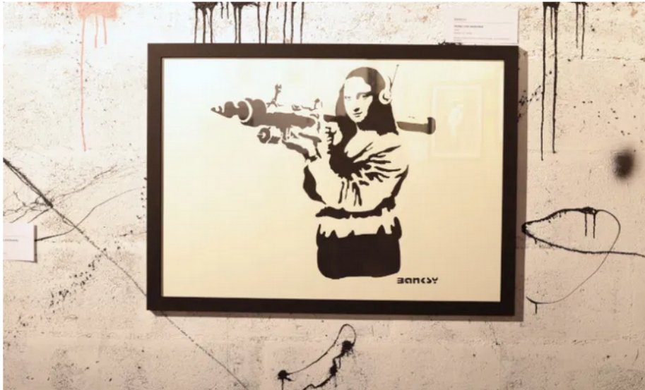
Mona Lisa bazooka, réalisée au pochoir sur papier en 2015, symbolise la puissance de l'art. Collection privée.

François a rencontré Banksy à Londres en 2007 : « en allant jouer à Londres dans un festival de théâtre de rue, je me retrouve par hasard dans l'atelier d'un graffeur. Je ne sais pas qui il est et découvre son travail. En visitant l'atelier, il me propose d'emporter deux dessins qui me plaisent. Je choisis les plus petits au format de mon sac à dos. Je pars, fin de l'histoire. »