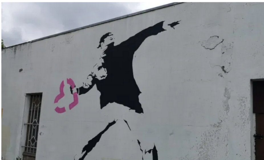
Les ateliers du théâtre et des arts, à Grigny, jouxte le quartier de La Grande Borne.

Depuis son ouverture, ce lundi 28 juin, l'exposition événement a déjà attiré de nombreux journalistes, locaux et nationaux. Du côté des visiteurs, la Banksy humanity collection n'attire pas que les habitants de Grigny. Et c'était l'effet voulu par la compagnie La Constellation – acteur culturel et social sur le territoire depuis 2015 à travers le projet La Croisée des chemins – la Ville de Grigny et le bailleur des Résidences Yvelines-Essonne .