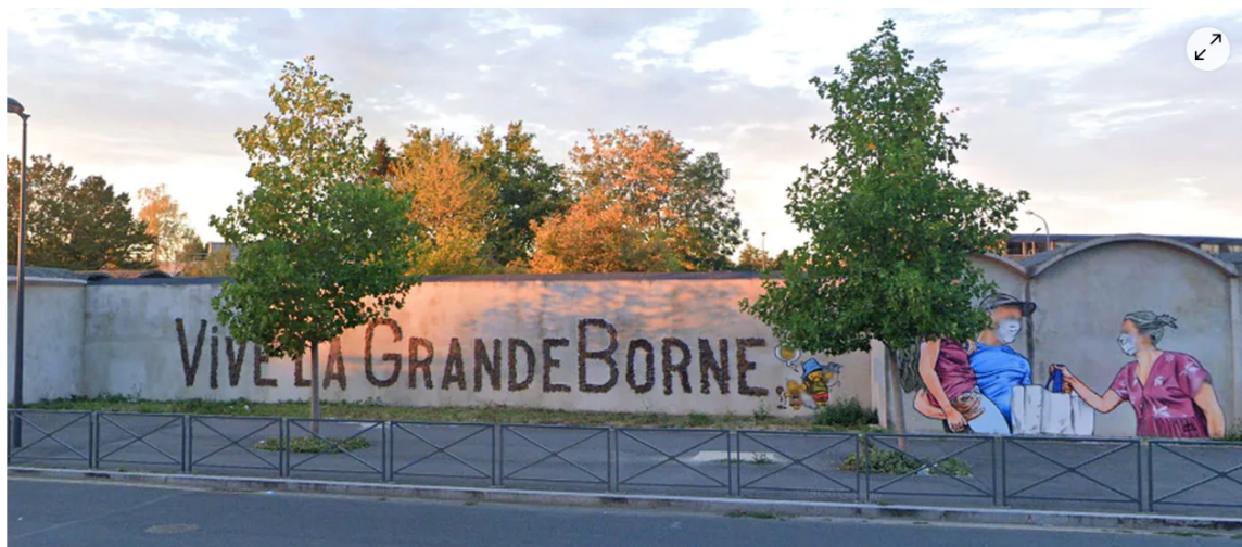
Le quartier de la Grande-Borne à Grigny.